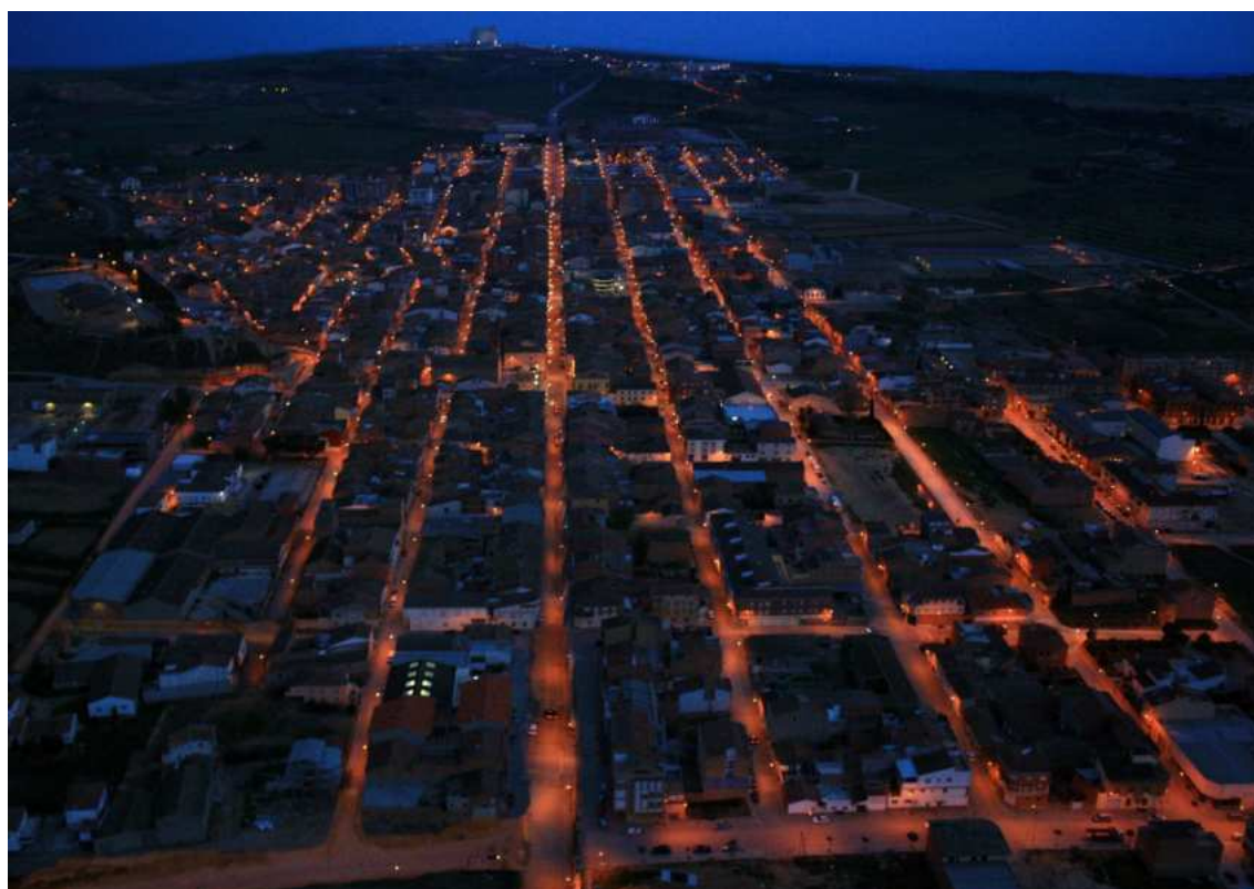
Foto nocturna d'Almacelles

Els carrers de la nova vila eren rectes i ben amples per on poguessin passar la gent a peu i els carruatges